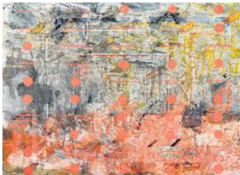
‘BY THE 600th Day’, óleo sobre lienzo, 72 x 96 pulgadas.

Esta obra dialoga directamente con otro de los cuadros de gran formato. Concebido también en tonos sobrios, casi monocromático, Low Level Learning sobrepone formalmente la idea de laberinto y ciudad. A modo de filigrana, la silueta de un individuo que se sobrevive gracias a la asistencia de una máscara de gas y equipo de protección, se multiplica sobre el cuadro. La inquietante multitud organizada en líneas que se alternan como en las fotos de graduación, se hace por momentos visible y a ratos se desdibuja como sí rastros de la tiza sobre el pizarrón escolar. La progresiva gradación de claro a oscuro desde la parte superior del cuadro hacia la inferior, así como las flechas de carácter unidireccional, marcan el sentido selectivo de la información y el correspondiente lugar del individuo en la sociedad en dependencia del nivel