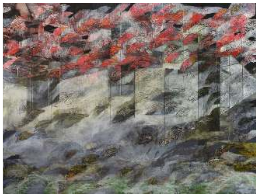
‘THE BEAUTIFUL Ones’, óleo sobre lienzo, 72 x 96 pulgadas.

An Ode to Those Who Made the Most Mistakes es una pieza de sobriedad conceptual que alude a uno de los experimentos de Tolman en el que se pone a prueba el aprendizaje latente y los mapas