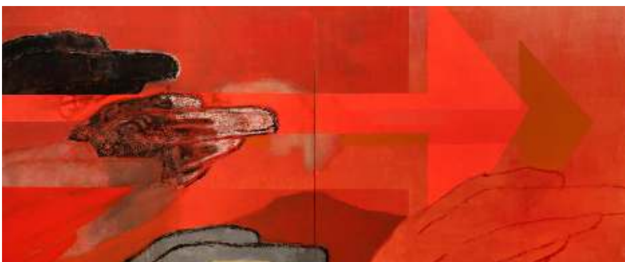
'MONAD', ÓLEO sobre lienzo, 60 x 144 pulgadas.

The Measure of Man toma su título prestado del libro publicado por Dreyfuss en 1960 donde la antropometría es puesta en función del diseño de objetos ergonómicos. Interesado en la calidad de